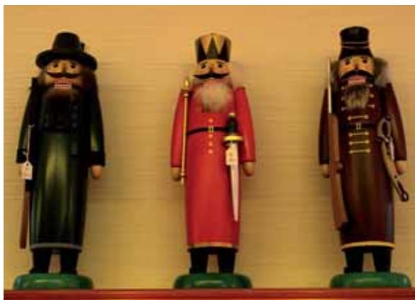
Nussknacker aus dem Erzgebirge